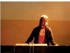
Electrosacher – Italia

Abe es un artista intensamente versátil. Su exploración musical parece no tener límites, conservando siempre un refinado gusto y un sonido muy personal. Es catalogado como productor de productores, un pionero.