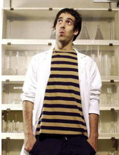
Original Hamster - Chile

Experimentado músico produciendo “con cualquiera que quiera poner su carrera musical en riesgo”. Hay pocos estilos con los cuales no ha trabajado: Hip hop, funk, rock, pop, techno, folk, hasta reggaetón.