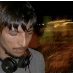
Alvaraado - Chile

Productor, propietario del sello OHM records y uno de los creadores del festival Electroblog. Sus sets se acomodan con gran facilidad gracias a su búsqueda de novedades con las que llena los mostradores de su tienda de discos en Trieste, Italia.